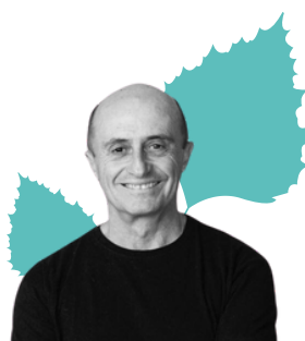
El humor en el tiempo de los monstruos con Pepe Viyuela